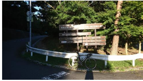
(通過チェック・フォトコントロール③) 水とふれあいの広場