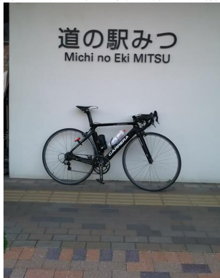
■通過チェック①フォトコントロール 道の駅 みつ 道の駅 みつに来たことがわかれば原則OKです。以下入り口写真