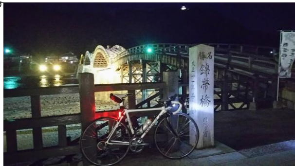
■通過チェック⑤錦帯橋