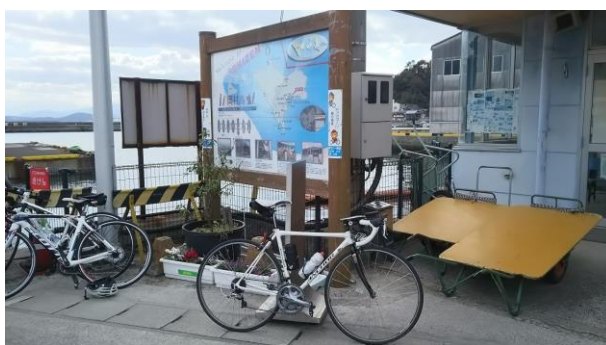
■通過チェック③（フォトコントロール）岡村島フェリー乗り場