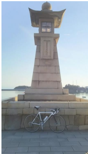
■通過チェック②（フォトコントロール）鞆の浦 常夜塔