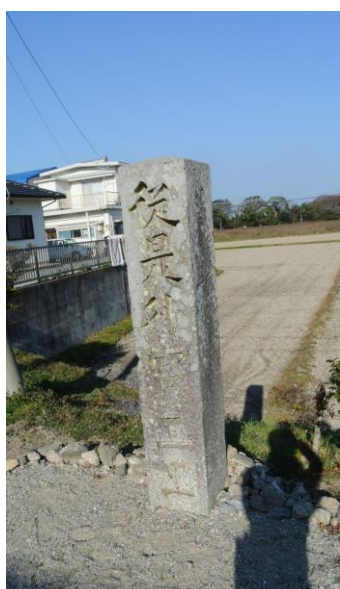
通過チェック1a 従是外宮三里 石碑