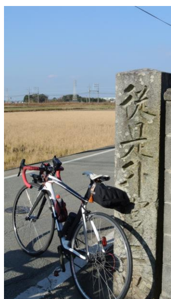
通過チェック1c 従是外宮二里 石碑