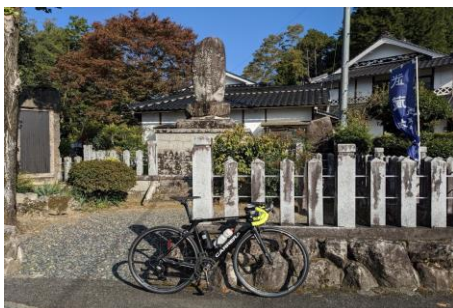
通過チェック② (フォトコントロール) 石碑『宮本武蔵生誕地』