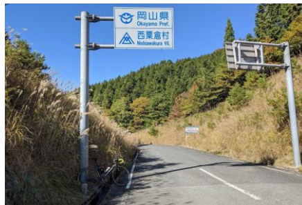
通過チェック① (フォトコントロール) 岡山県西栗倉村 標識