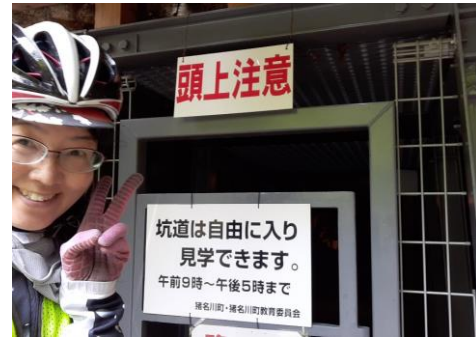
青木間歩坑道入口 あるいは坑道の中でもOK (写真チェック②)