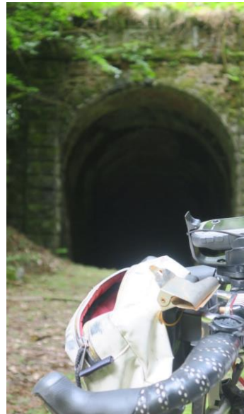
(すみません、上手に写真とれませんでした。皆さんはもっと上手に撮れると思います(滝汗)) (写真チェック③b)