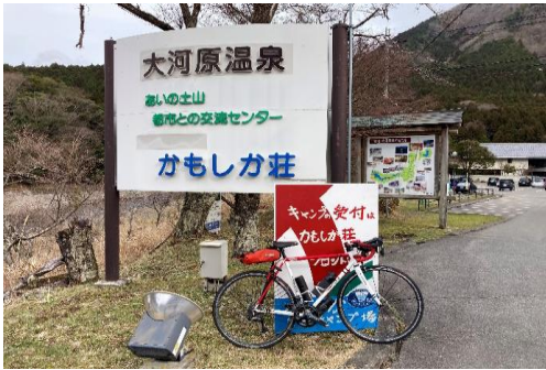
PhotoControl-1 大河原温泉かもしか荘 看板