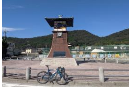
PC1 湯郷温泉 からくり時計