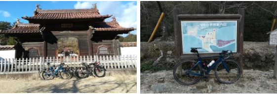
通過チェック③(フォトコントロール) 旧関谷学校