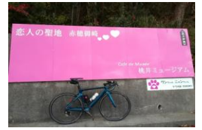
通過チェック⑤(フォトコントロール) 赤穂御崎 恋人の聖地 看板