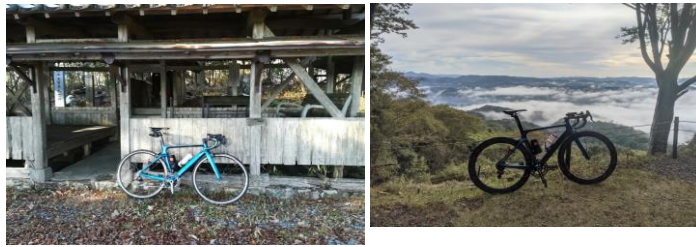
(通過チェック・フォトコントロール)① 佐用の朝霧展望ポイント