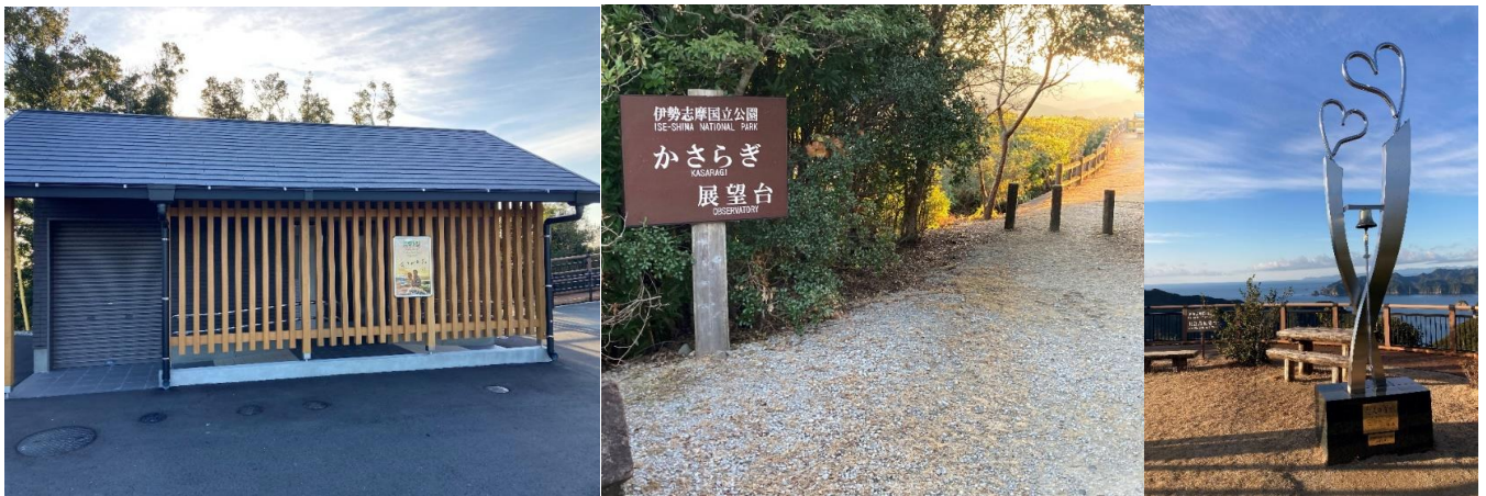
Photo Control-2 海ほおずき