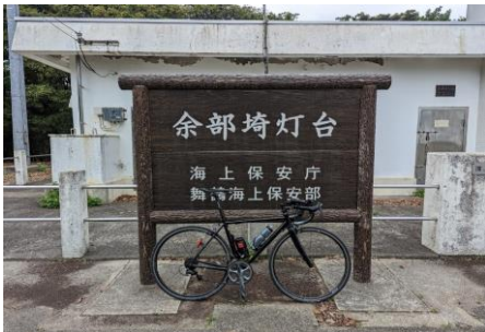
通過チェック④(フォトコントロール)余部崎灯台