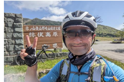
通過チェック⑧(フォトコントロール) 鉢伏高原 看板