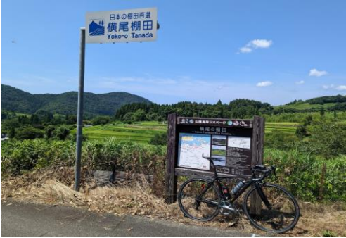
(通過チェック・フォトコントロール)③横尾棚田 看板