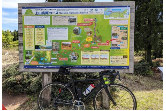
(通過チェック・フォトコントロール)②上山高原コース看板