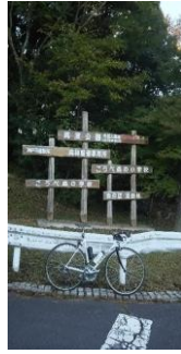
(通過チェック・フォトコントロール)①再度公園入口