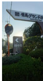
(通過チェック・フォトコントロール)⑩有馬グランドホテル 看板