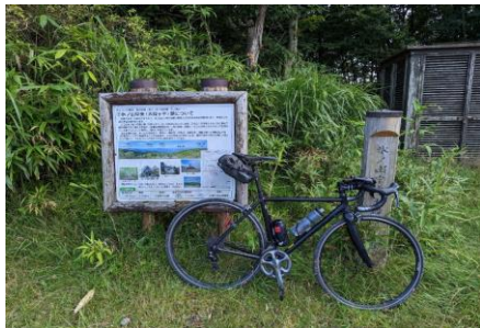
通過チェック⑧(フォトコントロール)大段ヶ平駅 看板