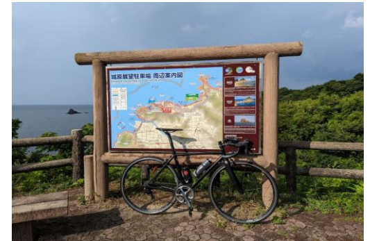
(通過チェック・フォトコントロール)④城原展望所 看板