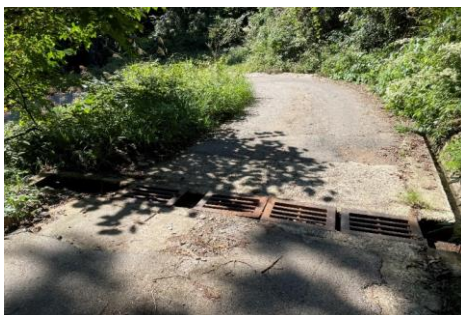
折立峠の下り140. 1kmポイント注意