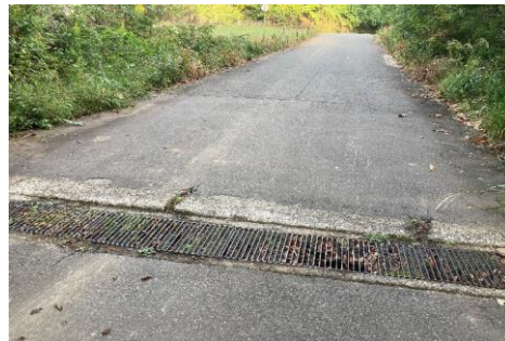
31. 5kmポイント逆さグレーチング