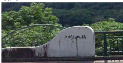
(通過チェック・フォトコントロール)① 上都あゆみ橋