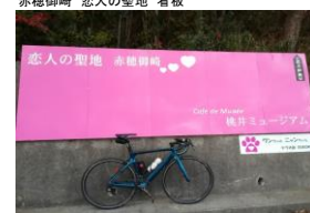
通過チェック⑤(フォトコントロール) 赤穂御崎 恋人の聖地 看板