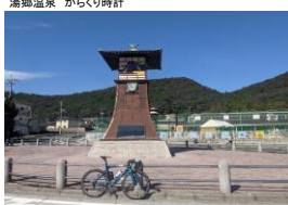
PC1 湯郷温泉 からくり時計