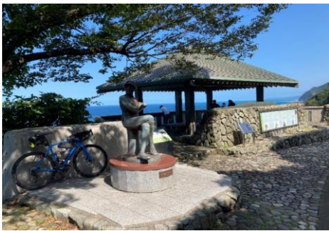
通過チェック 親不知展望台