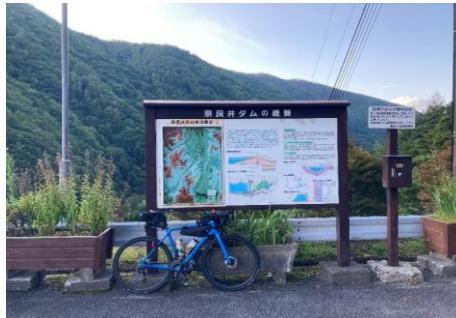
通過チェック 奈良井ダム