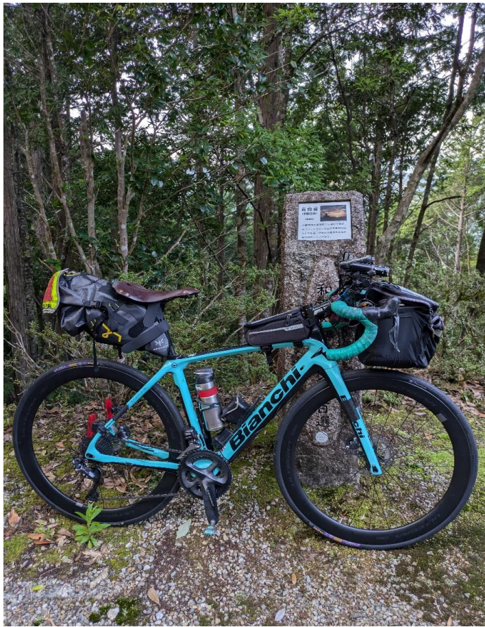
フォトチェック1 和歌山朝日夕日百選 百間蔵