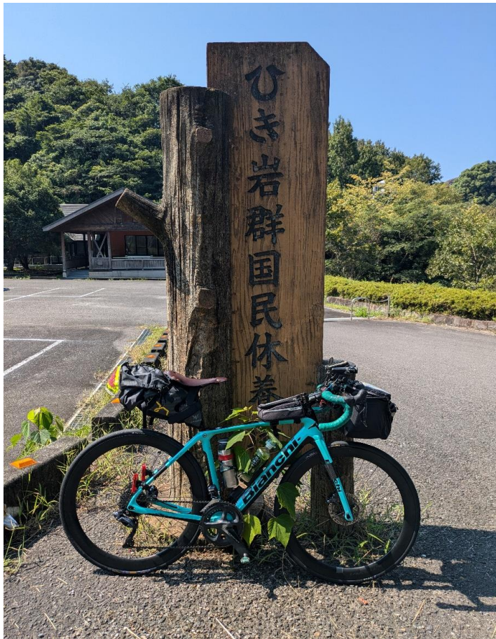
フォトチェック3 ひき岩郡国民休養地