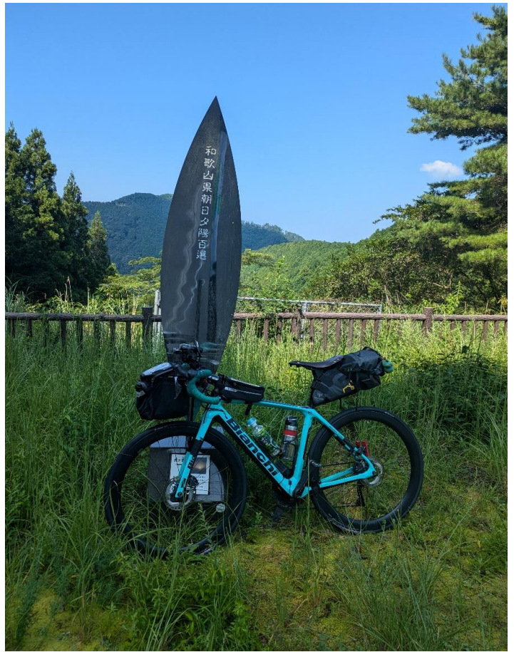
フォトチェック2 和歌山朝日夕日百選 虎ヶ峰