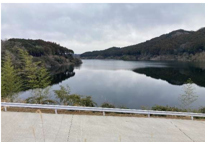
誰もいない静寂に包まれたダム湖。水面の下には村が沈む。