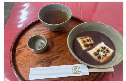
伊勢で赤福 まだぜんざいが頂けます。