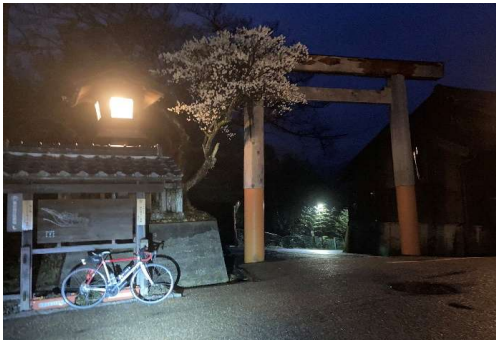
PhotoControl-3 関宿 大鳥居