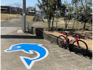
通過チェック6 クイズポイント（押しボタン信号）