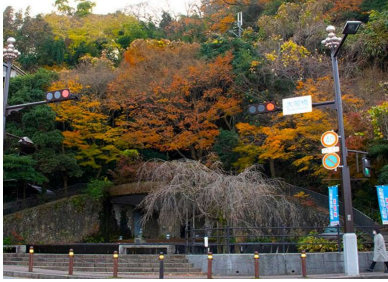
(通過チェック・フォトコントロール) ③ 太閤橋 ゆけすけ広場