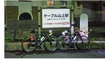
六甲ケーブル山上駅