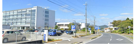
(通過チェック・フォトコントロール) ② 加東市役所