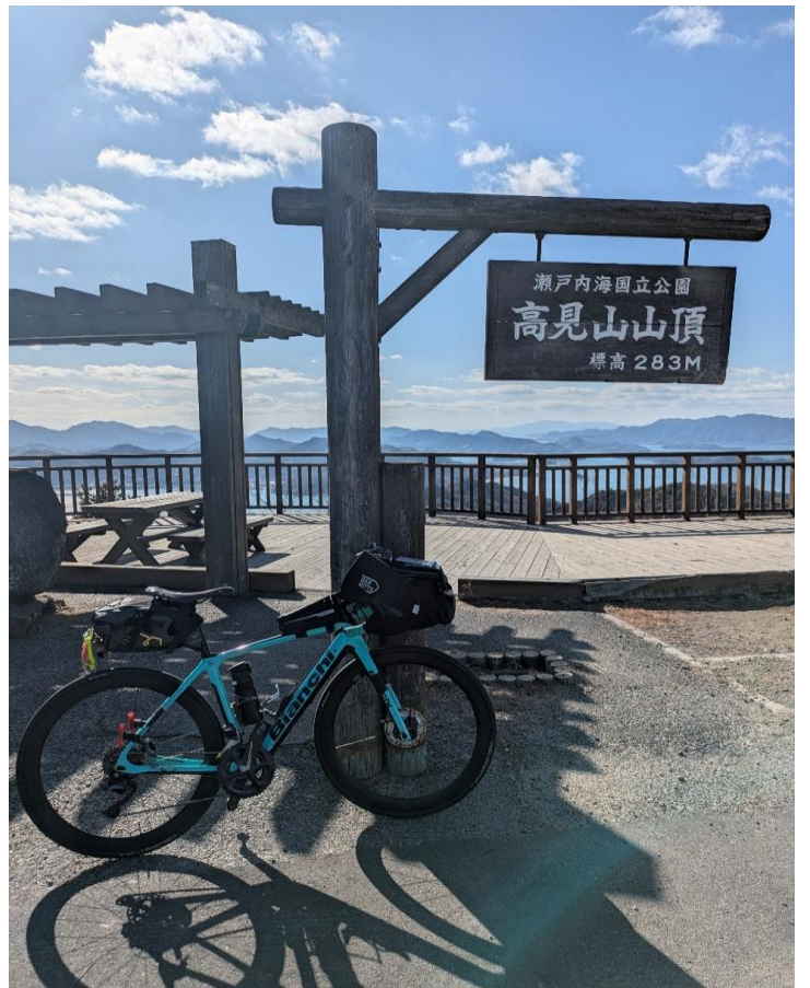
フォトチェック3 高見山展望台