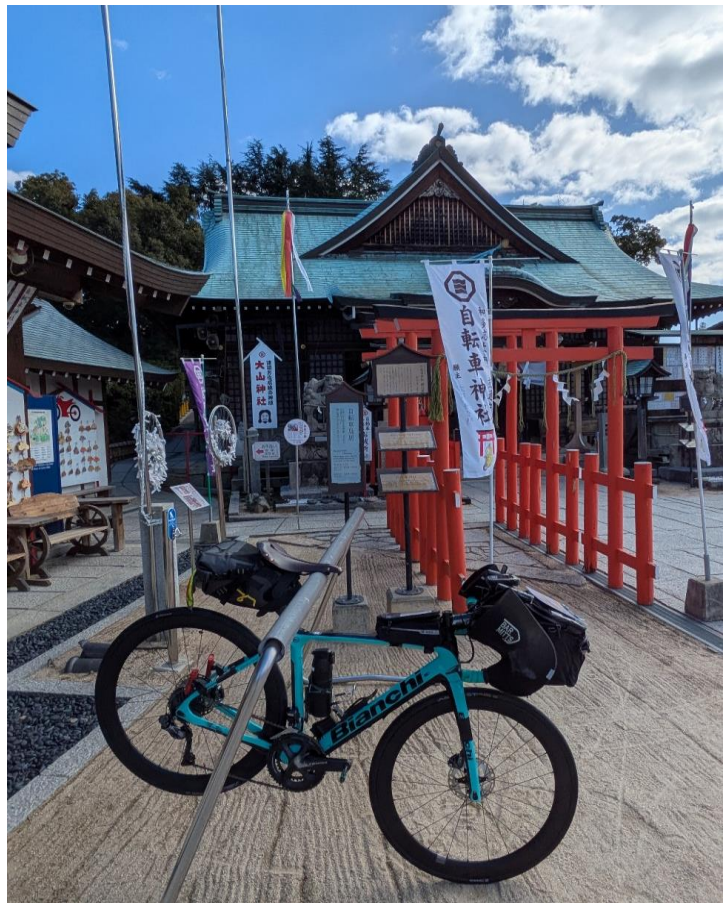
フォトチェック2 大山神社