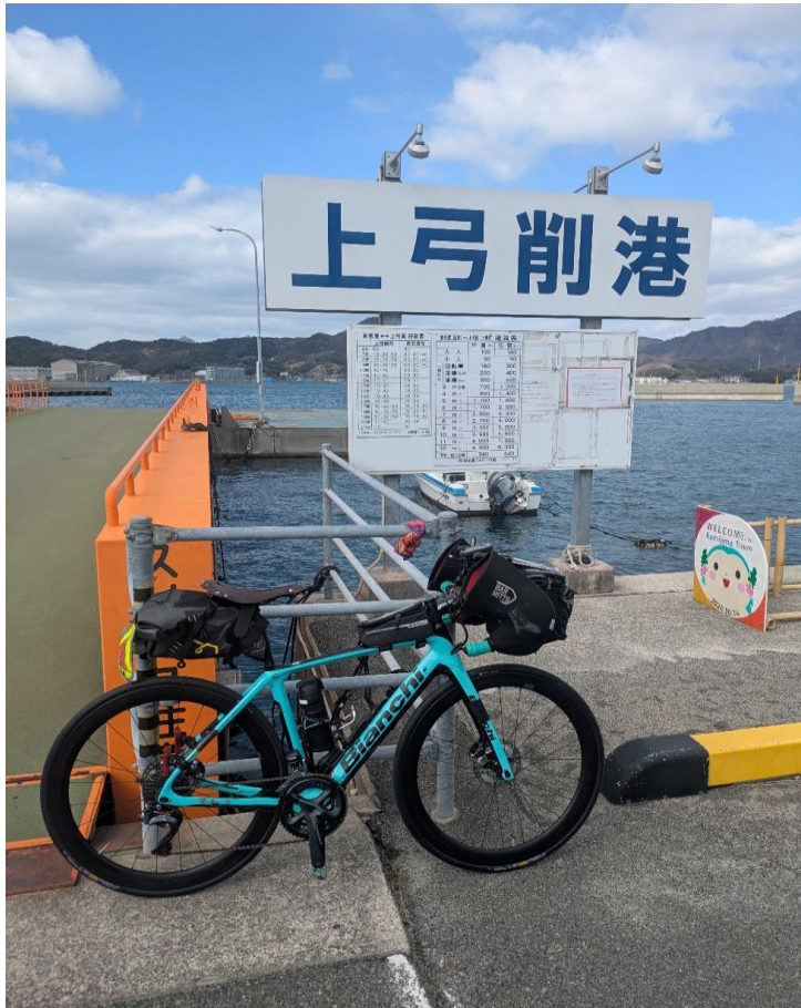
フォトチェック1 上弓削港 又は 家老渡ふえりの船内