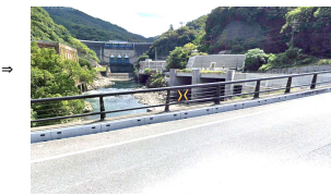
※Google Street Viewにはまだありません