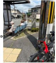
バス停の表は車通りもあり 撮影にいいので裏から 石碑・ベンチが入った写真でOK